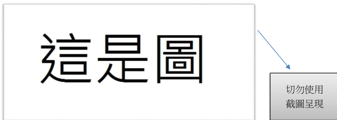
圖1-2 (字體加粗) 圖表標題但長度不可以超過圖的寬度